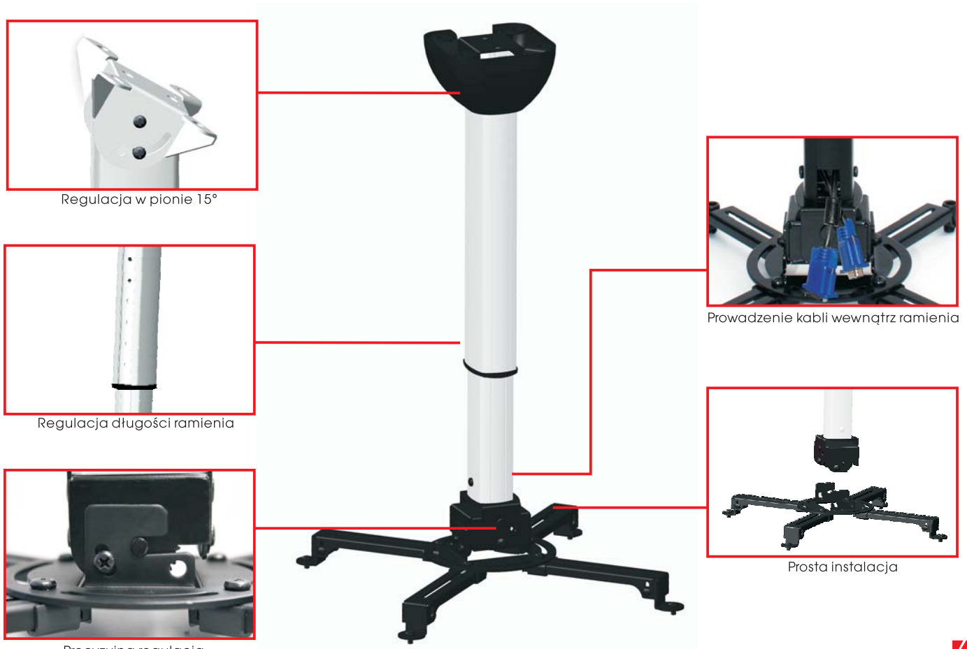
Regulacja w pionie 15°